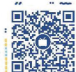
福建学生资助 哔哩哔哩号